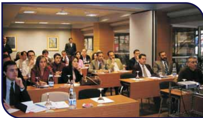
Evento de Facturación Telemática (Hotel Palafox)

La estrategia de Comex Grupo Ibérica no se limita a una mera intermediación comercial, sino que apostamos por convertirnos en integradores de dichas soluciones, de tal forma que nuestros Clientes perciban, por un lado, la capacidad de la solución aportada y, por otro, la misma cercanía y atención que precisa la relación comercial.